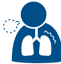
صعوبة في التنفس