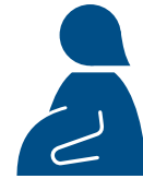
Phụ nữ đang mang thai