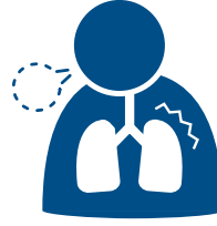
सास फेर्न गाह्रो

मान्छे अनुसार लक्षणहरूको गम्भीरता फरक हुने हुनाले कुनै लक्षण गम्भीर लागेमा, तुरुन्तै परामर्श लिनुहोस्।