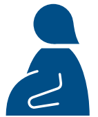
Phụ nữ đang mang thai

● Phụ nữ đang mang thai hoặc người có trẻ nhỏ vui lòng tham khảo trên trang web.