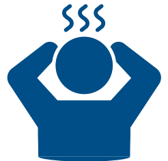
Mataas na lagnat