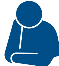
Matinding pagod (malaise)